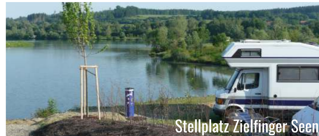
Stellplatz Zielfinger Seen

Der Stellplatz beim Seencamping Krauchenwies liegt direkt am Ufer des Ablacher Sees, einem Bade- und Angelsee, der unseren Gästen exklusiv zum Baden zur Verfügung steht.