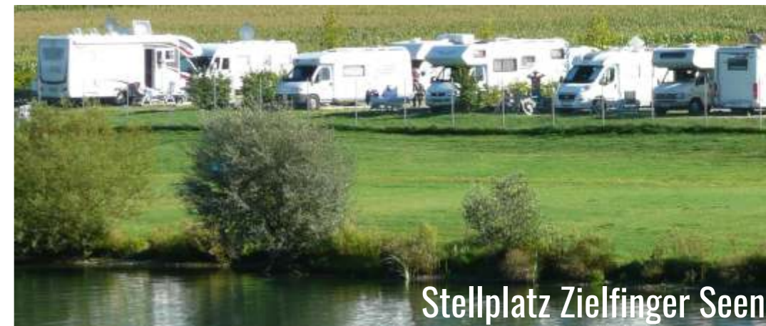
Stellplatz Zielfinger Seen

Der Stellplatz beim Seencamping Krauchenwies liegt direkt am Ufer des Ablacher Sees, einem Bade- und Angelsee, der unseren Gästen exklusiv zum Baden zur Verfügung steht.